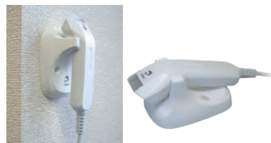
ウォールマウント/デスクトップ/対応