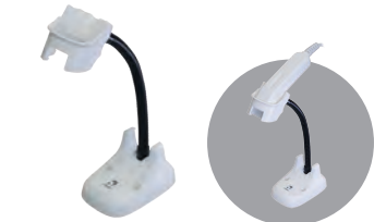
省スペース設計スタンド